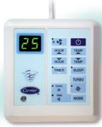
รีโมทมีสาย แบบมีตัวเลขไขว่จูนทุกปี (อุปกรณ์มาตรฐาน)