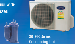
38TPR Series Condensing Unit

Condensing Unit ออกแบบพิเศษ โดยผ่านมาตรฐานการทดสอบ ให้ Compressor ทำงานอย่างต่อเนื่อง 3,500 ชั่วโมง