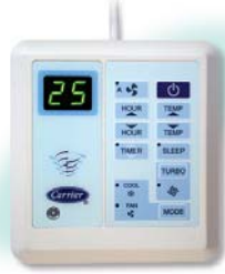
รีโมทมีสาย แบบมีตัวเลขไขว่ลูกศรทุกมี (อุปกรณ์มาตรฐาน)