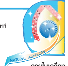
ภายในเครื่อง