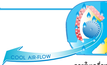
ภายในเครื่อง

ระหว่างเครื่องปรับอากาศทำงาน จะมีความชื้นเกาะอยู่ภายใน