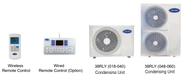
Wireless Remote Control

หมายเหตุ, 2134-2553 : This standard cover room air conditioner of split type, having net total cooling effect not exceeding 12,000 watt.