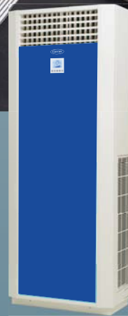
(Optional-Acrylic Front Panel)