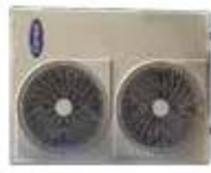
38RGT (048-060) Condensing Unit