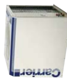
38LB SERIES Condensing Unit

บริษัท แครเรียร์ (ประเทศไทย) จำกัด Carrier (Thailand) Ltd. 1858/63-74 ชั้น 14, 15 Floor, บางนา-ตราด กม. 4.5, บางนา กรุงเทพฯ 10260 Thailand โทร. 0-2762-9222 แฟกซ์: 0-2751-4778