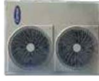
38RGT (048-060) Condensing Unit