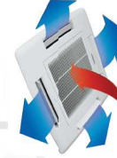
4 Way Airflow

หมุนปรับได้ 4 ระดับความสูง สมตามตำแหน่งลม